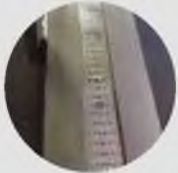
Ölçüm Cetveli Measurement Chart