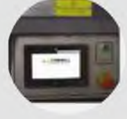
Dokunmatik Kontrol Paneli Touchscreen Control Panel