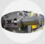
Hidrolik Şerit Gerdirme Hydraulic Blade Tensioning