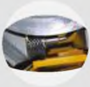
Motor Tahrirli Talaş Fırçası Motorized Swarf Brush