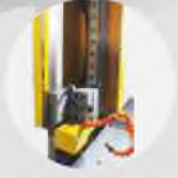
Şerit Yataklama Bandsaw Guide