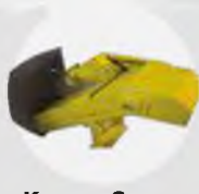
Kazıyıcı Sıyırıcı Talaş Konveyörü Scraper Type Swarf Conveyor